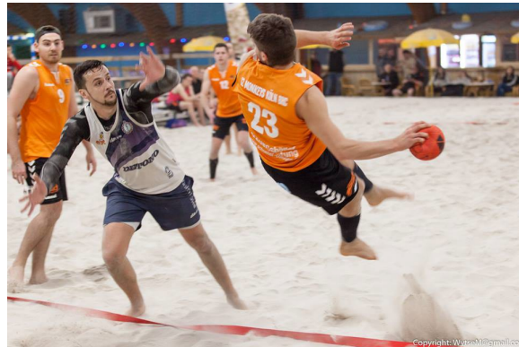
Limburg Indoor International Beach Handball Tournament 2017